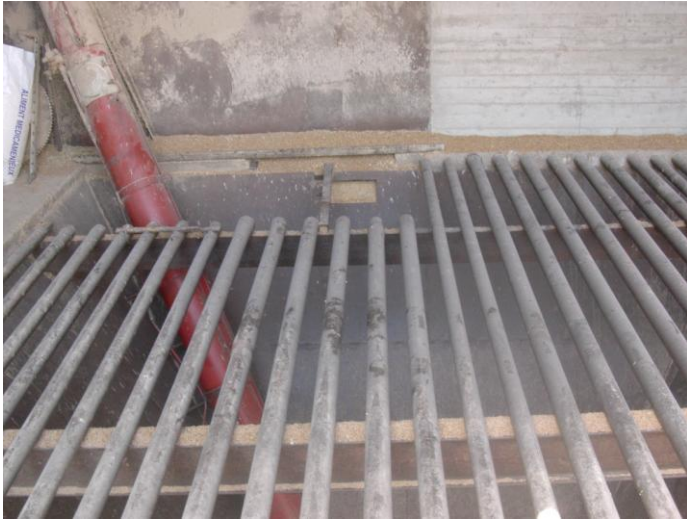
Grille sur la fosse réception