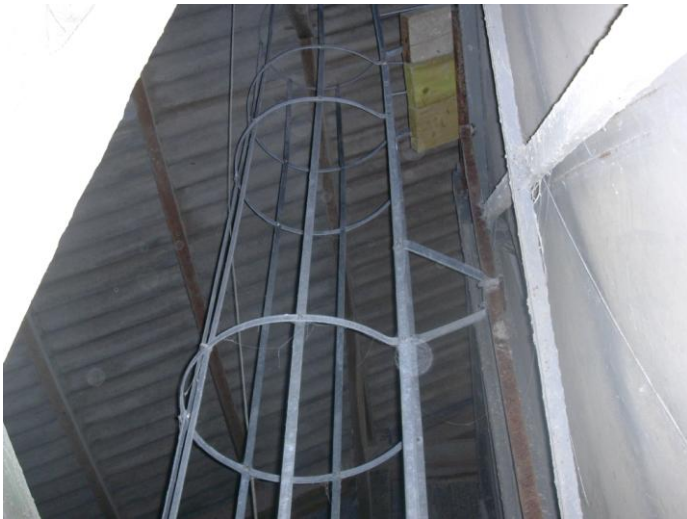
Echelle fixe avec crinoline