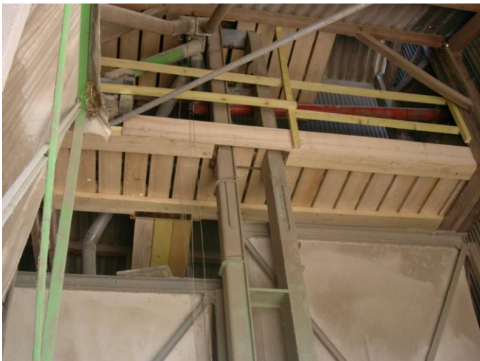
Passerelle munie de rambardes